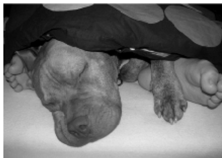
Pitbull Rasty hřeje, mazlí, hlídá a věrně doprovází svého milovaného, handicapovaného člověka

„Byl to pesek, kterého jsem si přesně vždycky přál. Odmítl jsem asistenčního psa, kterého mi nabízel sdržení Pomocné tlapy, protože jsem chtěl mít psa vlastního a to od štěněte. Asistenční psi přicházejí k majiteli již jako dvouletí. Chtěl jsem také psa obránáře, ne jen hodného retrievra, ten by mě příliš na vozíčku neochránil. Vozíčkář je někdy v podstatě bezmocný. S pitbullem po boku je to ale